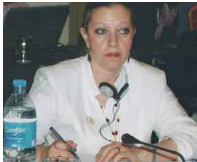
Madame Maya Sahli Fadel, Commissaire à la CADHP.

Enfin je voudrai ici me réjouir de la création de la CNDH sahraouie (Commission Nationale des Droits de l'Homme) qui va demander son affiliation à la Commission et son adhésion au réseau africain des INDH (Institutions nationales des droits de l'homme) demande d'adhésion importante car le CNDH marocain est présent dans ce réseau, la RASD pourra-t-elle y entrer ?