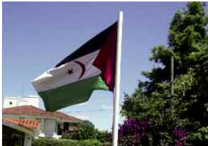
Ambassade de la RASD à Abuja, Nigéria

Au moment où nous rédigeons, ce 30 janvier 2015, les chefs d'État et de gouvernement se réunissent en session ordinaire à Addis-Abeba. Session sans doute historique pour la RASD, car les résolutions qui viennent d'y être prises, indiquent un tournant significatif dans la volonté de l'UA de reprendre en main le sujet.