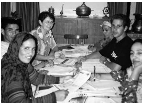
Soirée de révisions à la Maison diocésaine avant le test final.