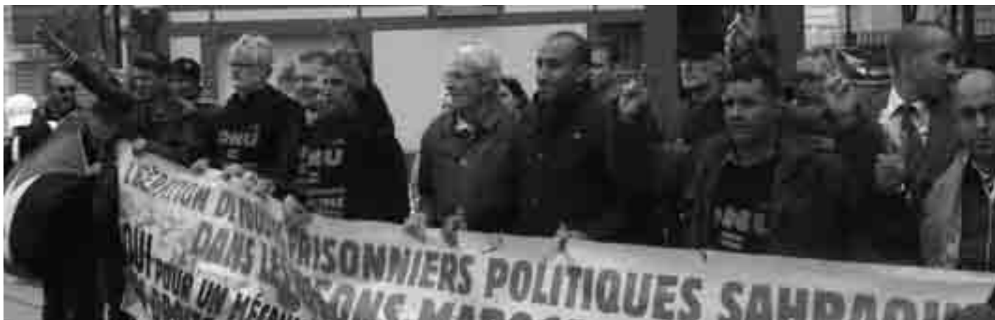
Arrivée des randonneurs-militants à Gonfreville, 11 mai 2013

Comment célébrer le 40 e anniversaire de la création du Front Polisario et les anniversaires des jumelages des villes du Mans et de Gonfreville l'Orcher avec les campements d'Houza et de Jréfia ? Prendre à la fois une initiative festive et solidaire en mobilisant le plus possible d'acteurs et surtout communiquer autour de la cause sahraouie ?