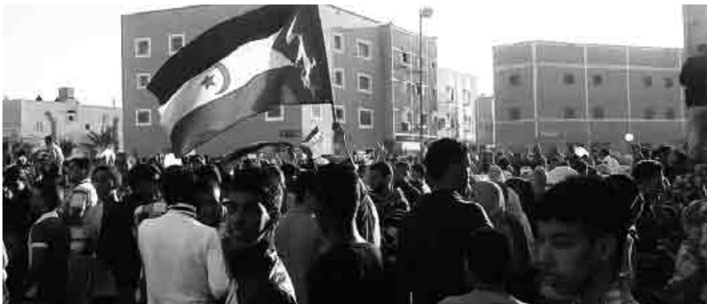
Manifestation à El Aïoun, Avenue de Smara, le 4 mai.... les manifestants ont compté jusque 8000 personnes !

Le Front Polisario à l'issue de sa réunion du Secrétariat national, s'est vivement félicité de l'engagement américain, préparant ainsi la visite du Président Abdelaziz aux États-Unis, avec des rencontres à meilleur niveau que précédemment, a relativement « ménagé » la France l'appelant à une contribution positive pour trouver une solution... Par contre, le porte-parole du secrétariat a dénoncé l'Espagne « qui s'est dérobée à sa responsabilité juridique et morale » mais a salué l'engagement de l'Union Africaine disposée à coopérer avec Christopher Ross. Engagement largement manifesté à l'occasion de l'anniversaire de l'OUA et UA ( 50 ans) fêté en mai à Addis Abéba, avec l'invitation en tant que personnalité d'honneur d'Aminatou Haïdar et le vote de résolutions appelant à l'autodétermination du Sahara occidental. RV