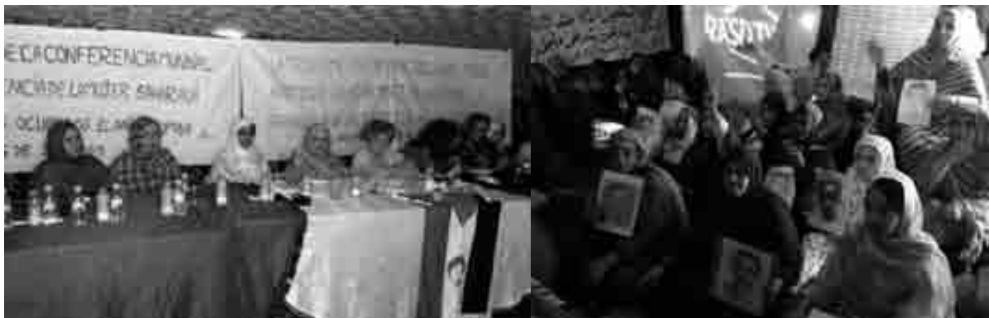
Conférence internationale, tribune et une partie de l'assistance. Plusieurs présentes tiennent la photo de leur parent disparu.

La troisième conférence internationale du soutien aux femmes sahraouies vient de se tenir à El Aïoun, dans le territoire du Sahara occidental ce 16 juin 2013. Edition exceptionnelle, historique car organisée par les femmes sahraouies, militantes des territoires occupés, avec à leurs côtés le collectif des associations, à l'œuvre pour imposer la mémoire, l'identité sahraouie et débouchant toutes sur l'exigence du droit à l'autodétermination.