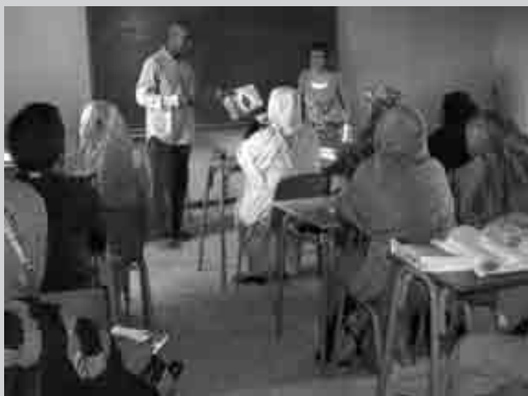
Cours de français au Centre de formation du 9 juin, mai 2013.

Enfin nous discutons longuement, après une courte intervention de Claude des prisonniers de Salé, deux décisions sont prises : organiser les missions d'observateurs pour le procès à nouveau fixé au 1 er février et reprendre le parrainage des prisonniers.