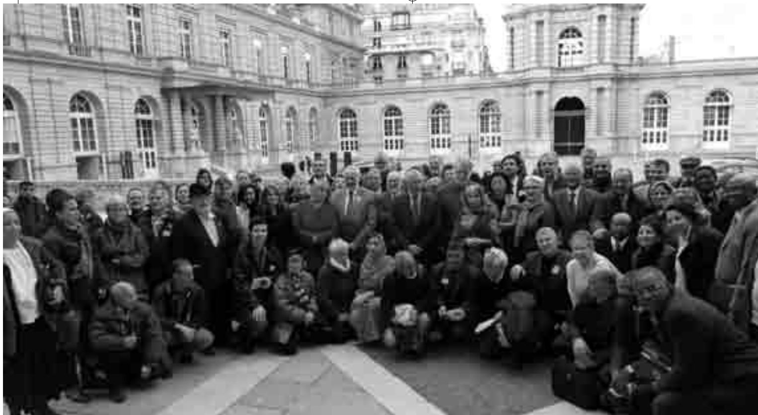
Dans la Cour du Palais du Luxembourg, le 2 février, une partie des participants à la Conférence.

Le même Canard a « pointé » à nouveau « l'impatience marocaine » dans son édition du 22 mai, révélant les pressions exercées sur la chaîne TV5 monde par l'Ambassadeur du Maroc à Paris, pour modifier les intervenants de l'émission programmée par cette chaîne sur le Sahara occidental.