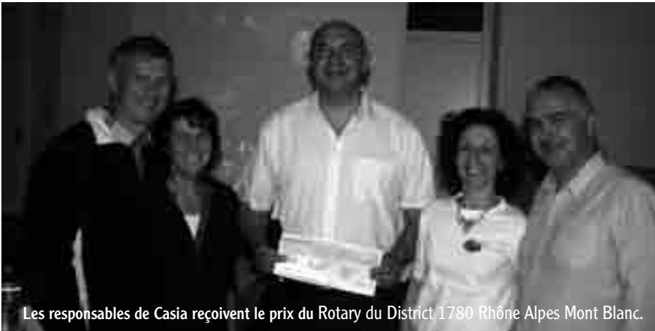
Les responsables de Casia reçoivent le prix du Rotary du District 1780 Rhône Alpes Mont Blanc.

Notre association a été créée en mai 2011 suite à l'accueil des enfants sahraouis depuis 2006. Avec une douzaine de familles nous nous sommes lancés dans cette aventure, en lien avec l'association des Amis de la RASD. Chaque année c'est toujours avec le même enthousiasme que nous préparons leur arrivée, certaines familles sont avec nous chaque été, mais d'autres nous arrivent régulièrement.